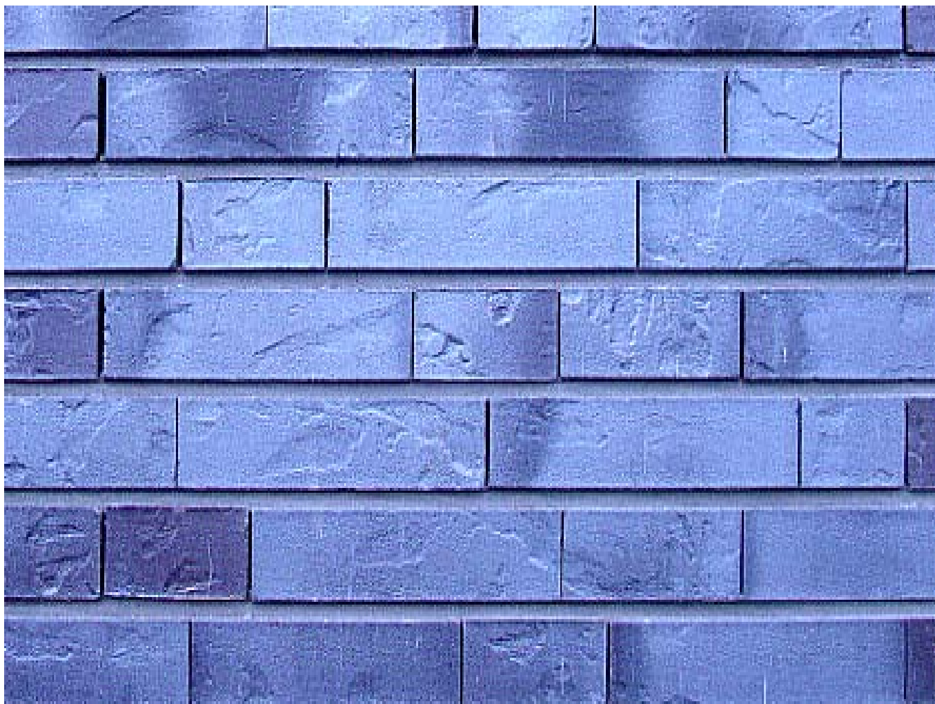
Voorbeeld: Leeuwarden, Friesland college, antraciete 5 mm verdiepte voeg, strengperssteen