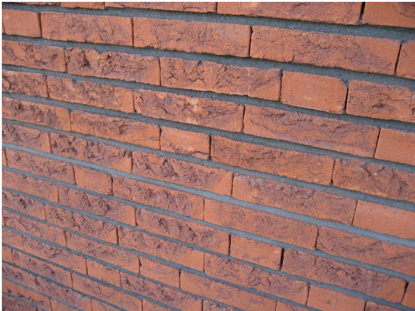
Voorbeeld: Den Haag, scholen de verademing aan de Asmanstraat, doorstrijkmethode, antraciet, 5 mm verdiept, h.v. steen 41N50 oranje blauw zand