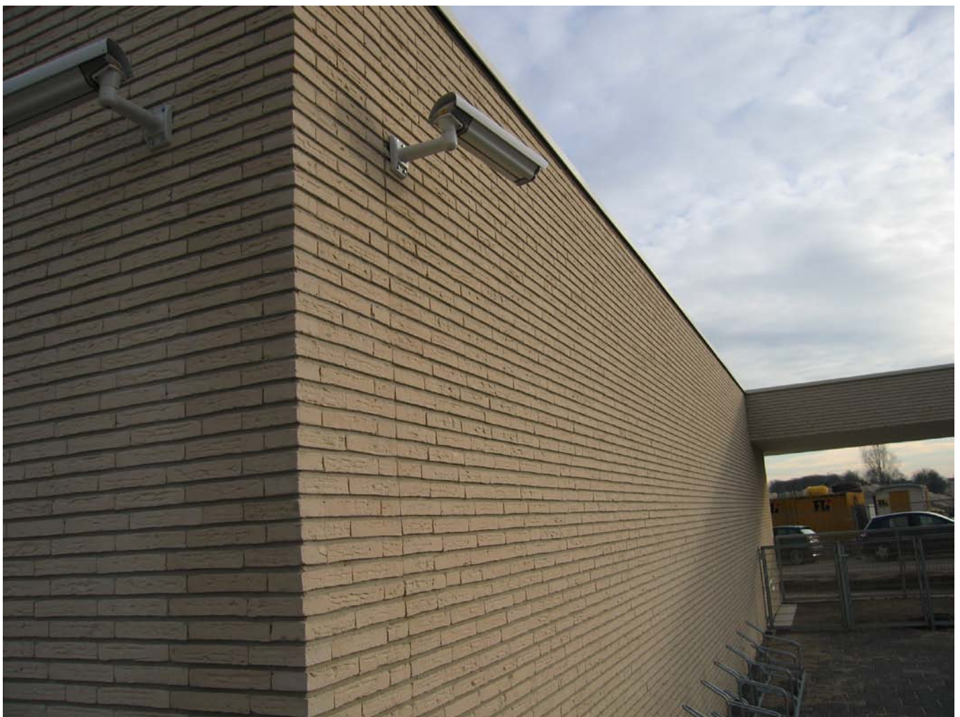
Benadrukken van de horizontale belijningen.

Des te hoger de lintvoeg (maximaal ongeveer 13 - 13,5 mm i.v.m. de uitvoering) en des te dieper de lintvoeg (maximaal ongeveer 10 mm i.v.m. de uitvoering) des te meer wordt die belijning benadrukt.