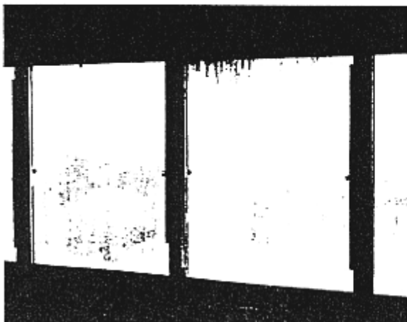
Figuur 3 Glasschade als gevolg van lekwater uit beton.