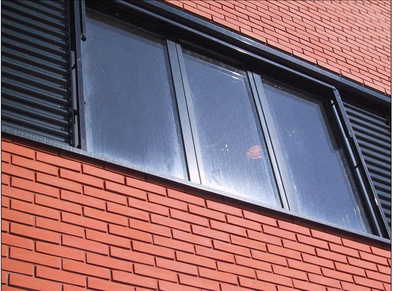
Algemeen beeld van de hierboven genoemde afzettingen op glas.