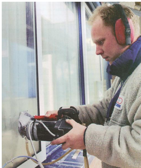
Polijsten van het glas.

Voor het tegengaan of eventueel ter voorkoming, van dit verschijnsel na eventueel glasherstel, kunnen er diverse oplossingen bedacht worden, zowel bouwkundig (zoals het weggeleiden van het water uit de muur, impregneren van de gevel), als door het geven van oppervlakte behandelingen (met polymeren aan het glas.)