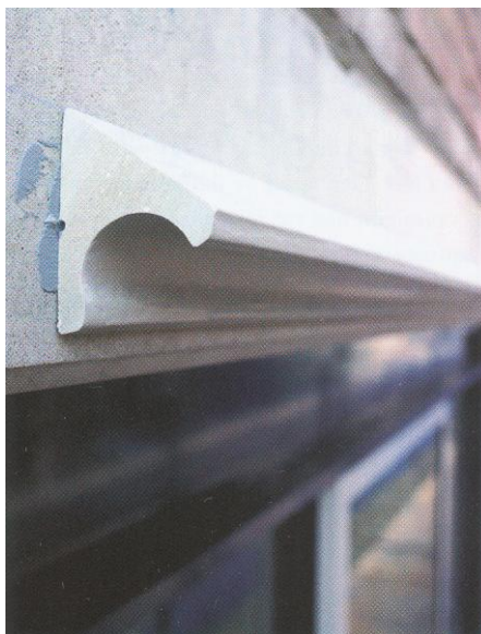
Voorbeeld van een druiprofiel.

Onze adviezen zijn naar ons beste weten gegeven, maar zijn echter geheel vrijblijvend, aangezien het resultaat altijd wordt bepaald door een complex van factoren die buiten onze controle of beoordeling vallen.